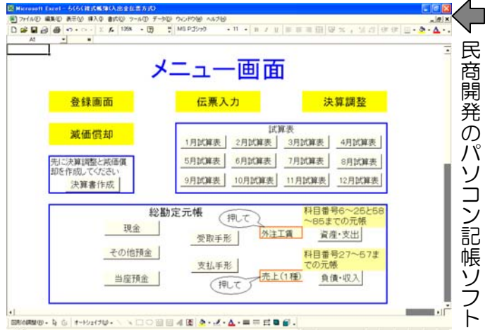
民商開発のパソコン記帳ソフト