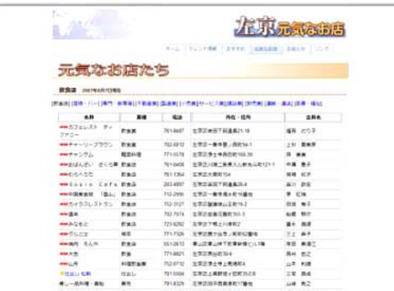
左京民商のホームページの店舗紹介欄

民商のネットワークで商売繁盛 左京民商では400軒近くになる会員のお店舗をホームページで紹介しています。先日は、このホームページを見られた方から「自宅の改修工事をするので業者を紹介してほしい」と電話があり400万円の工事の契約ができた工務店がありました。